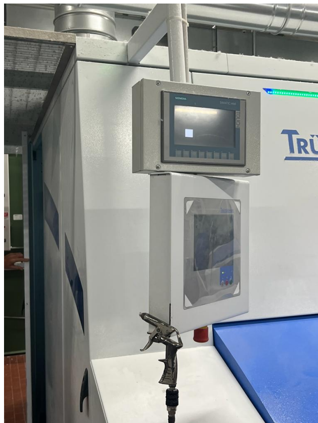
Foto 3 – Imagem do painel de controle da máquina de carda TC15, marca Trützschler.