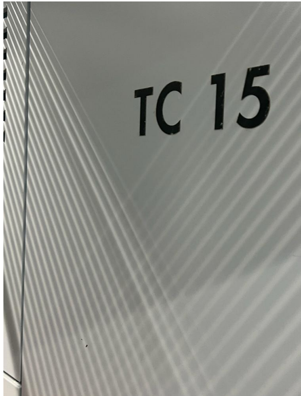
Foto 2 – Imagem da lateral da máquina de carda TC5, marca Trützschler.